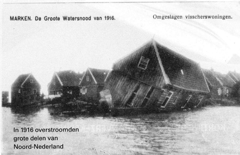
MARKEN. De Grote Watersnood van 1916.

Nadat in 1916 grote delen van het noorden van ons land overstromden, werd als reactie in 1932 de Zuiderzee afgesloten met de Afsluitdijk. De watersnoodramp van 1953 was onze laatste grote overstroming. Opnieuw reageerden we met de afsluiting van een groot deel van de delta: de Deltawerken. Ook werden hoge beschermingsnormen in de wet vastgelegd. Toen kwam, in 1993 en 1995, de dreiging ineens van een heel